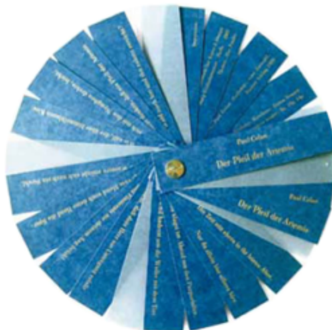
Diana Donald/Paul Celan: La flecha de Artemiso . Gofrado, dibujo a tinta, composición manual de textos, impresión tipográfica, encuadernación en abanico mediante tornillo de libro dentro de caja, 10 ejemplares 10,4 x 2,3 cm. 2007