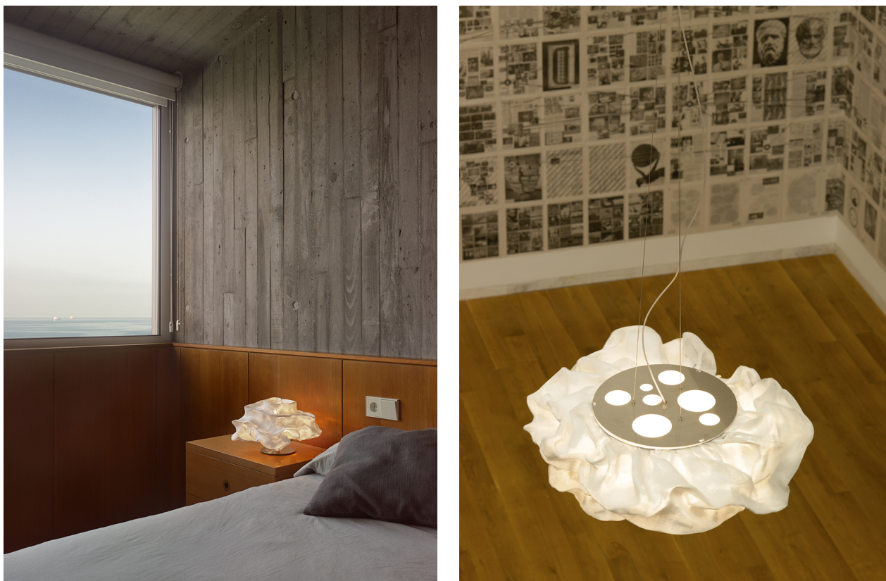
Fig. 3. Las lámparas de la serie Nevo presentan curvas modeladas a mano que recuerdan a los ritmos de la naturaleza.

El proceso creativo de Arturo Álvarez se mueve por la curiosidad que le lleva a explorar y descontextualizar elementos de lo cotidiano para concederles nuevos usos. Su condición autodidacta le aleja de prejuicios en la manipulación y las pruebas con cualquier tipo de materiales y objetos que encuentra a su alcance. En la entrevista publicada por Dis-up! Magazine comenta que su ejercicio creativo siempre ha consistido en “ver, experimentar, juntar, romper, mezclar materiales. Descontextualizarlos de sus usos habituales y conseguir, en el caso de las lámparas, juegos de clarososcuros soportados por formas y volúmenes” 7 . Pero es importante señalar que para Álvarez el diseño posee ante todo un fin funcional. Por ello, sus propuestas aportan una nueva visión de la iluminación creativa con un doble objetivo, que apuesta también por un bienestar del ser humano ligado al disfrute hedonista del objeto. A su vez, defiende que el diseño trata de ayudar al máximo número de personas haciendo sus vidas más fáciles y confortables, pero esta idea no se traduce en la realidad de mercado de la empresa, ya que sus precios se sitúan fuera del alcance de la gran mayoría. En este contexto, cuando relacionamos los procesos creativos de la marca con el pensamiento taoísta por su sencillez, humanismo y defensa de la naturaleza, encontramos cierta contradicción, ya que en las enseñanzas de Lao Tsé se realiza una fuerte crítica al lujo, al deseo o al ejercicio del poder 8 .