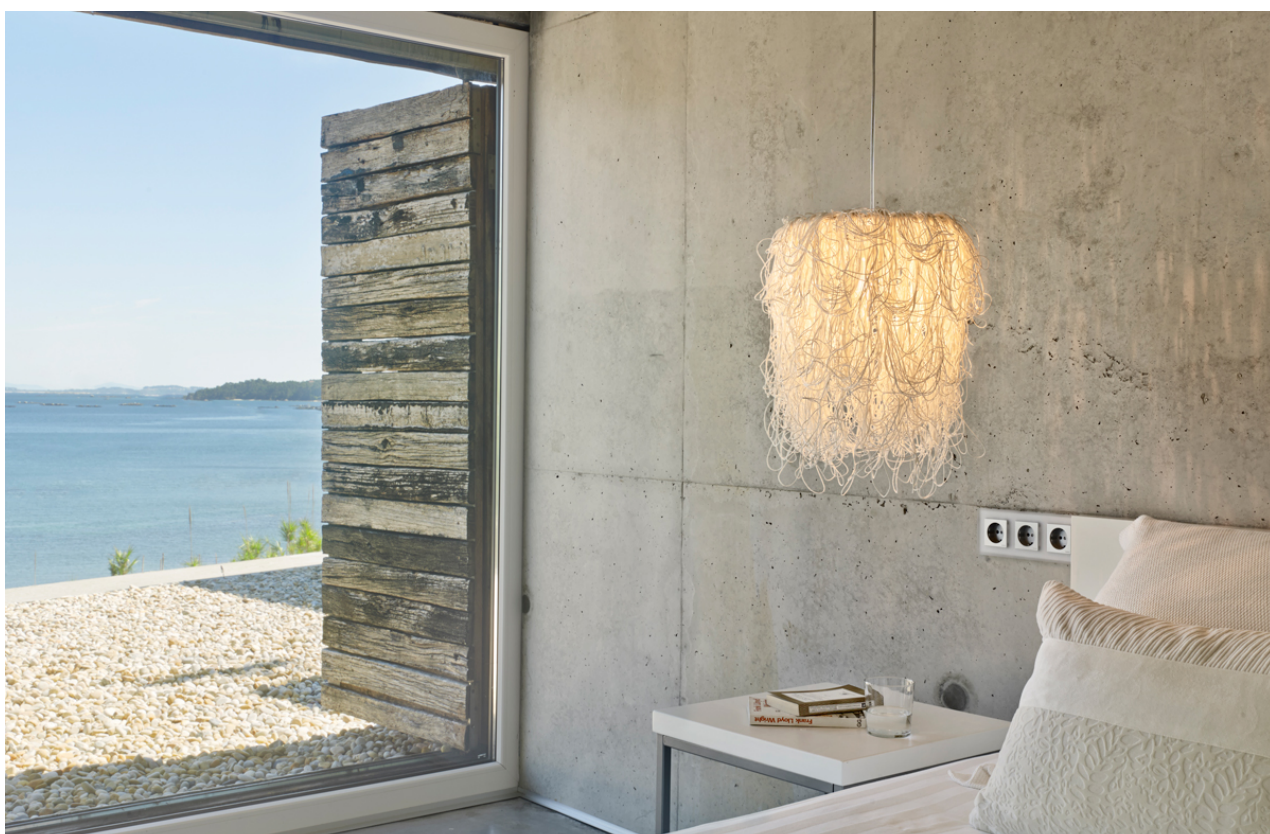
Fig. 10. Caos usa para su construcción cordón de celulosa reciclado. Cortesía de arturo alvarez .

La empresa se plantea continuar con su apuesta por la investigación, con la intención de desarrollar nuevos materiales para sus diseños y, al mismo tiempo, mantener su preocupación por la implementación de tecnologías que contribuyan al ahorro energético y a una producción sostenible. Tras la significativa creación y patente del Simetech ®, Álvarez confiesa que sigue trabajando con hilo japonés y alambre de acero. La curiosidad por poner las cosas al límite y su obsesión por el perfeccionismo son los motores que le llevan a prestar especial atención a la luminosidad y los clarososcuros, a la creación de un ambiente acogedor y, al tiempo, romper con toda limitación en la solución formal de sus productos.