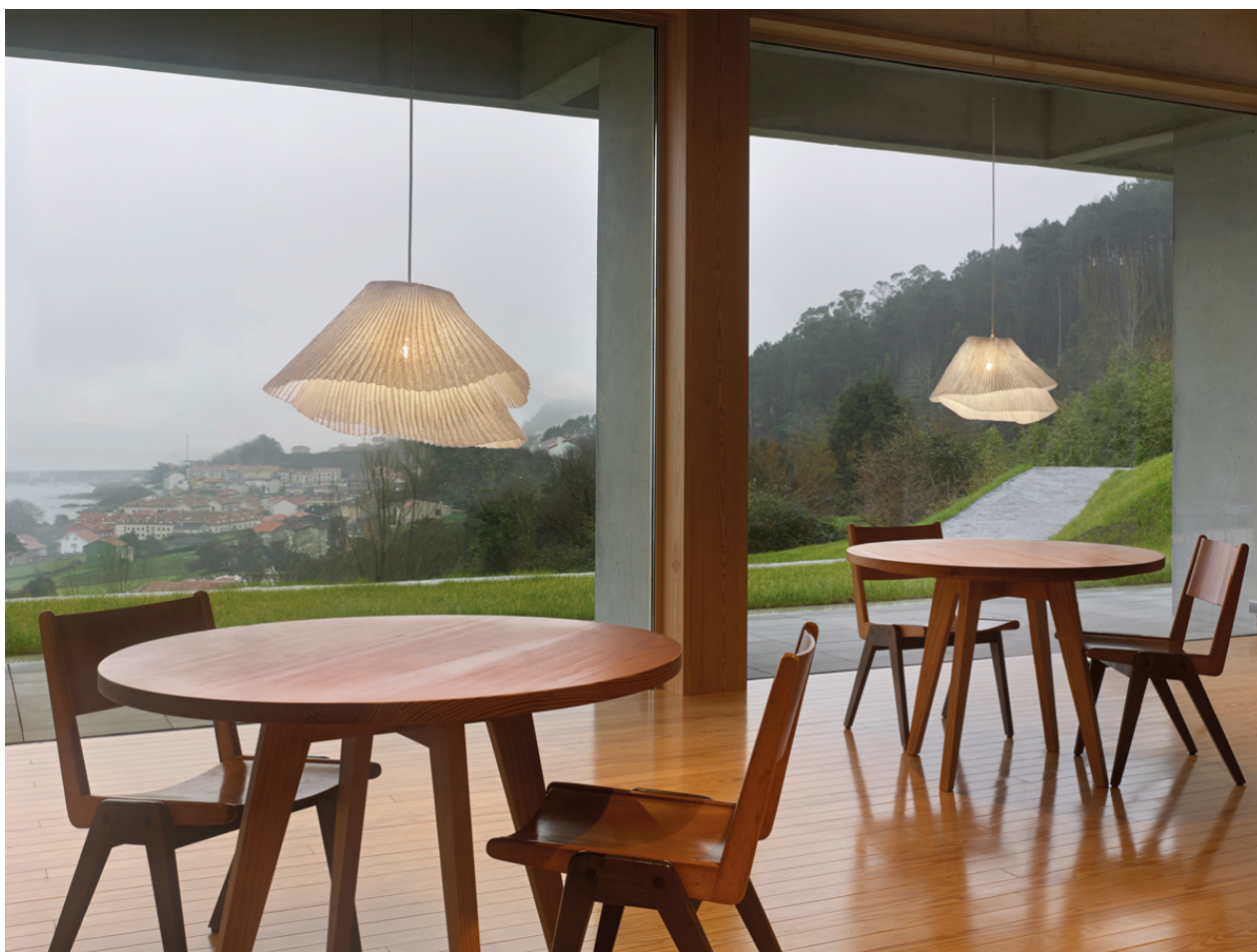
Fig.4. Tempo nos plantea una reflexión existencial atendiendo a los ritmos vitales.