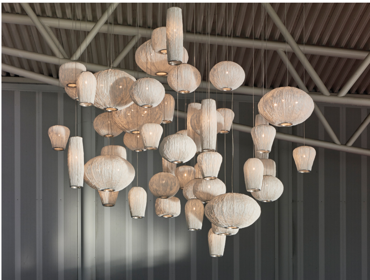
Fig.7. Composición de la colección de lámparas colgantes Coral . Cortesía de arturo alvarez .

seguido su propio ritmo y dirección, en lugar de adoptar la mentalidad occidental, eventualmente se hubiesen encontrado soluciones radicalmente diferentes. Ante este planteamiento podríamos pensar que “los propios principios de la física y de la química, considerados bajo un ángulo distinto al de los occidentales, habría tenido aspectos muy diferentes a los que hoy en día se nos enseña en lo que respecta, por ejemplo, a la naturaleza y las propiedades de la luz, de la electricidad o del átomo” 19 . Tal vez por ello, el estilo japonés, sus gustos, soluciones o formas, relucen de un modo peculiar. Partiendo de un antiguo artículo, Tanizaki nos plantea una hipótesis en la que pudiéramos suponer que el creador de la estilográfica hubiese sido japonés o chino. No cabría duda de que en lugar de la punta de una plumilla hubiera situado un pincel. Y en lugar de tinta azul, habría colocado algún tipo de líquido parecido a la tinta china. Esto, junto con el desarrollo del papel, hubiera provocado el auge de los ideogramas y la escritura silábica de los kana , desfavoreciendo a su vez el eco de los caracteres latinos. Con esta digresión Tanizaki muestra que “la forma de un instrumento aparentemente insignificante puede tener repercusiones infinitas” 20 .