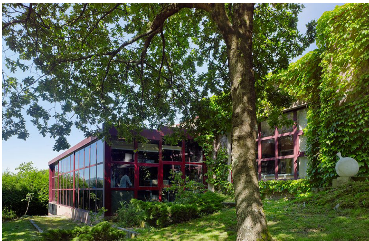
Fig. 2. Vista exterior del taller.