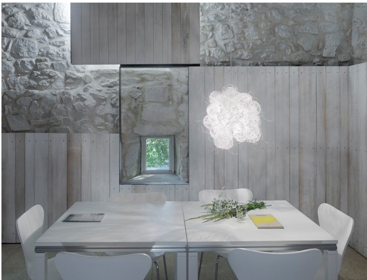
Fig.6. El diseño Blum seduce con su orden caótico. Está realizada con hilo de acero inoxidable pintado.