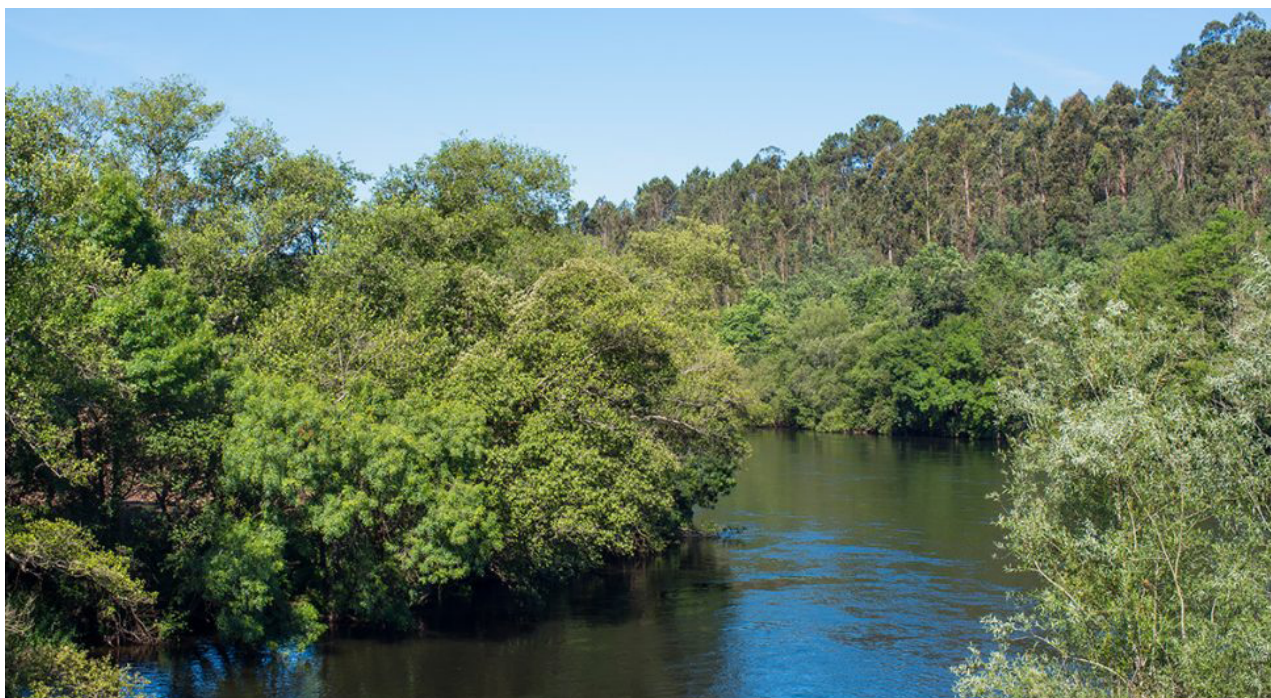
Fig. 1. Entorno natural de Vedra, cerca de Santiago de Compostela, Galicia.