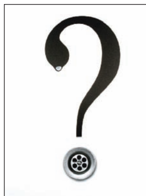
_Pablo Gargo. Ganador de Diseño Gráfico