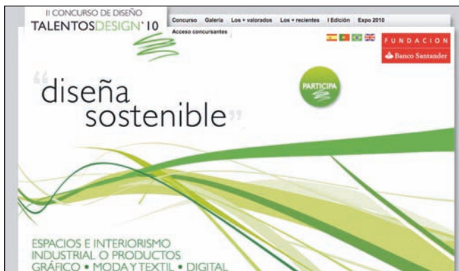
_Página web del concurso. http://talentosdesign.fundacionbancosantander.com/index.html